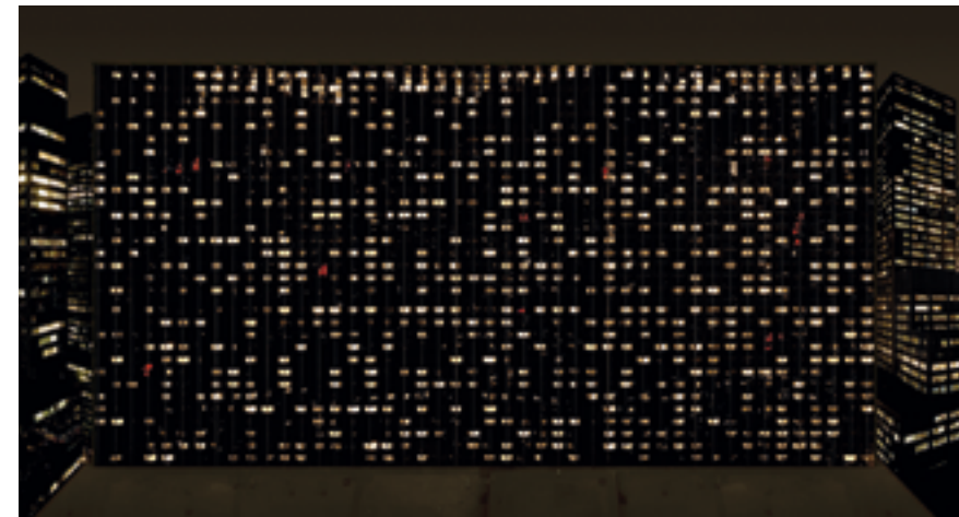
Avenue of the Americas, Andreas Gursky