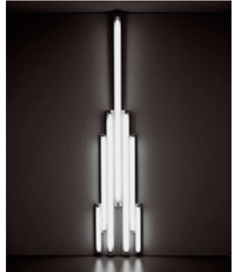
'Monument' for V. Tatlin, Dan Flavin, 1966–9