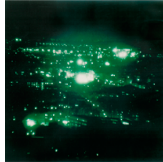
Nacht 20 1, Thomas Ruff, 1995