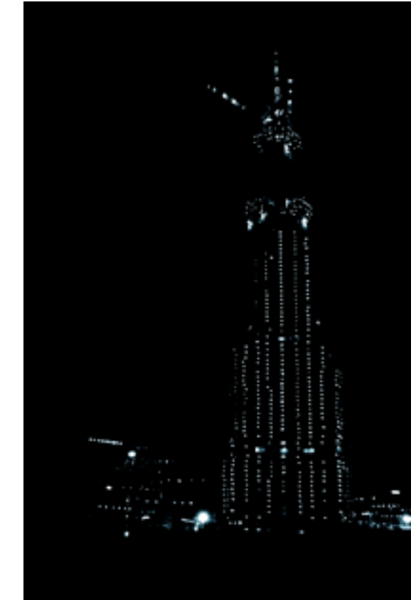
Burj Flavin-Tatlin, Susanne Schuricht, 2006